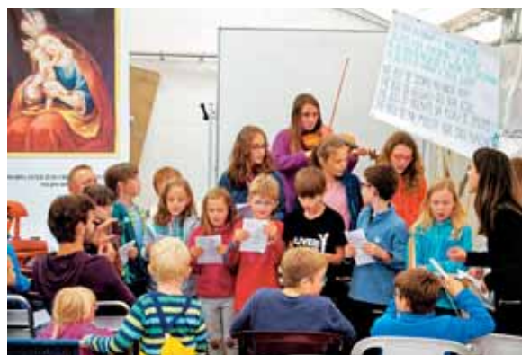
Pesem je pot, ki vodi v srca ljudi.