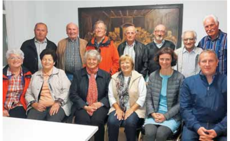
Cerkveni zbor Obzorje z župnikom