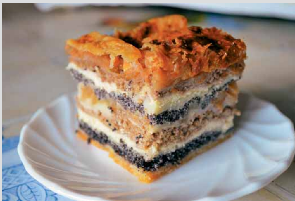
Prekmurska gibanica