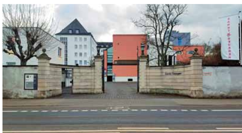
Vhod v filozofsko teološko šolo St. Georgen