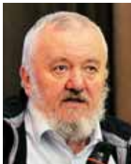
Prejemnik odličja sv. Cirila in Metoda

Povoda za podelitev najvišjega odlikovanja Cerkve na Slovenskem sta dva: 25. obletnica mednarodnega priznanja samostojne države Slovenije, ki ji je nagrajenec popolnoma zavezan, in skorajšnji 70-letni jubilej njegovega rojstva. Poleg tega prejemnika nagrade krasi njegovo trdno krščansko prepričanje, širjenje krščanskih vrednot in kritičen pogled na novejšo zgodovino slovenskega naroda. Kot dolgoletnemu kolumnistu in sodelavcu Naše luči dr. Grandi iskreno čestitamo!