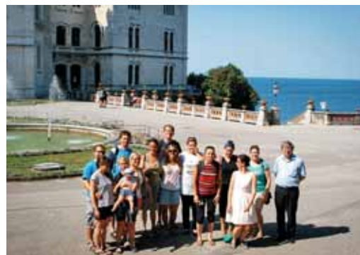
Skupinska fotografija višarcev pred gradom Miramar