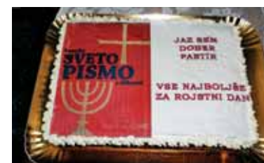
Torta za župnikov rojstni dan