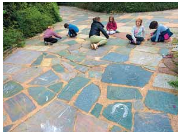
Otroci so našli velike risalne liste na granitnih ploščah.