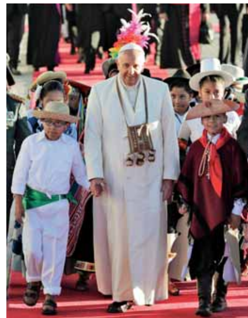
Frančišek se dobro počuti med otroki.

Vsebinsko je prvi stavek izjemno merodajen za razlago pisma. Izpoveduje namreč globok vpogled v besedi veselje in ljubezen. Ljubezen je razlog za veselje. Toda tudi v formalnem smislu je pomembljiv. Opozarja na prvi stavek Pastoralne konstitucije drugega vatikanskega cerkvenega zbora in pismo navezuje na tisti dokument, ki je usmeril pogled Cerkve na življenje vernikov. Izražena je jasna notranja vez med obema dokumentoma. Gaudium et spes (Veselje in upanje) se začneja z besedami: »Vesolja in upanja, žalosti in stiske današnjih ljudi ... so radosti in upanje, prizadetost in strahovi Kristusovih učencev. Ničesar pristno človeškega ni, kar bi ne odnavalo v njih srcih.« S pismom Radost ljubezni se navezuje papež Frančišek na temelj in odpira epohalne spremembe, ki jih je koncil sprejel pred več kot petdesetimi leti in oblikoval nauk Cerkve o zakramentalni zakonski zvezi. Koncil se je odma-