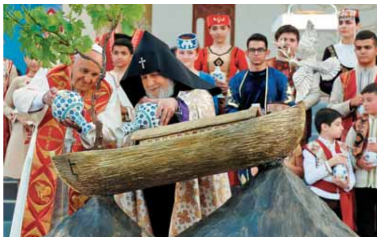
Papež Frančišek in katolikos Karekin II v Armeniji