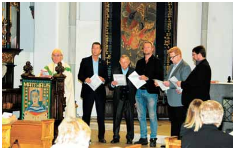
Člani Slovenskega cveta pojejo litanije v Kevelaerju.