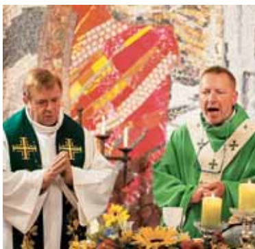
Duhovnika, ki sta se po uspešnem družinskem seminarju Bogu zahvalila za vse dobrote in sadove srečanja.