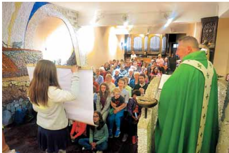
Do zadnjega kotička napolnjena kapela pri nedeljski maši v Merlebachu

je žena s srcem globokih slovenskih korenin.