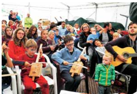
Pesem Poti nas je kot rdeča nit spremljala na družinskem seminarju.

V francoščini se je udomačila beseda rentrée , kar bi lahko poslovenili s povratkom, ponovnim začetkom. Pravi »rentrée pastorale«, začetek novega šolskega in pastoralnega leta, je bila dobro obiskana družinska maša, ki ji je sledil piknik na vrtu Slovenskega pastoralnega centra. Blagoslovilo nas je tudi krasno sončno vreme. Prijateljevanje smo nadaljevali vse do večernih ur. Bil je zares lep dan, ki nam ga je dal Gospod. Hvala vsem, ki so bili dragoceni gostje Slovenskega pastoralnega centra v Bruslju.