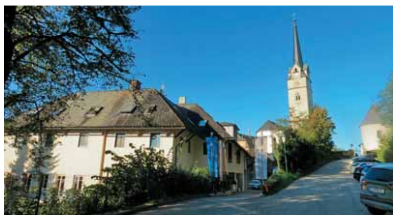
Hiša duhovno izobraževalnega središča Sodalitas v Tinjah na Koroškem