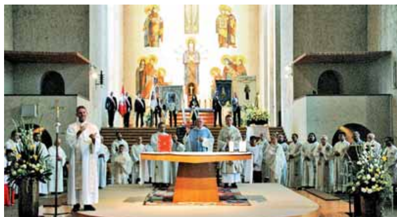
Pri Marijini maši so škofove besede lahko slišali tudi gluhi.