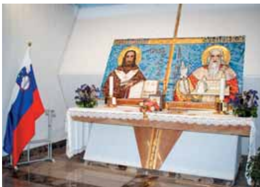
Slovenski oltar v cerkvi na Vejni