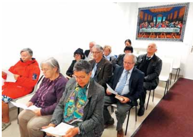
Spomin Jezusove zadnje večerje v hišni kapeli v Chatillonu