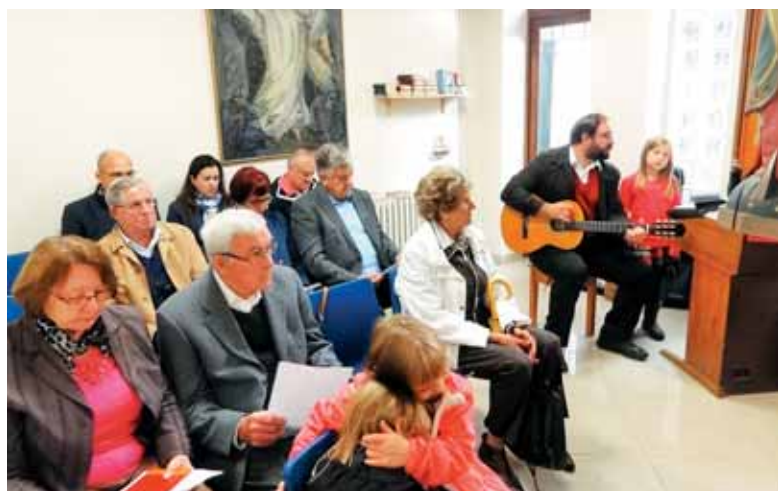
Utrinek s septembrske nedeljske evharistije v Parizu