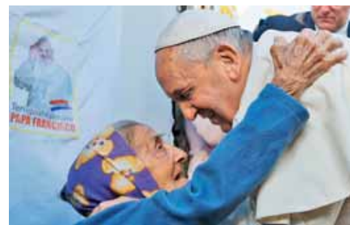
Papež Frančišek prinaša upanje in veselje srečanja.

K razumevanju papeža Frančiška lahko pripomore nek intervju pred nekaj leti. Kot kardinal v Buenos Airesu je Jurij Mario Bergoglio dal dva obširna intervjuja dvema novinarjema. Leta 2010 sta bila objavljena v Argentini, kasneje, ko je postal papež, sta bila prevedena in objavljena tudi v drugih jezikih. Novinarja sta vprašala kardinala o času, ko je bil predavatelj. Zvedeti sta želela, če ima kakšno formulo, ki jo priporoča, da bi se pri razlagi vrednot izognili rigorizmu in z druge strani relativizmu. Zanimal je, da bi lahko ponudil neko splošno 'formulo'. Pripomnil pa je: »Morda pa bi vam bilo v pomoč to, kar vam zdajle povem. Duhovnikom priporočam, naj ne bodo v spovednici niti ostri niti preveč širokosrčni. Rigorist je, kdor zagovarja norme brez vsake pozornosti do človeka. Kdor je preveč širokosrčen, pa pušča norme povsem vne-