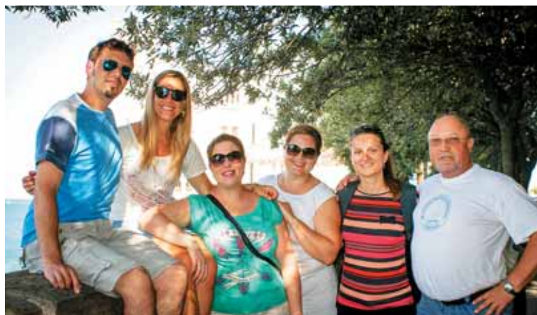
Del skupine na poti proti gradu Miramar, ki se dviga tik nad morjem.