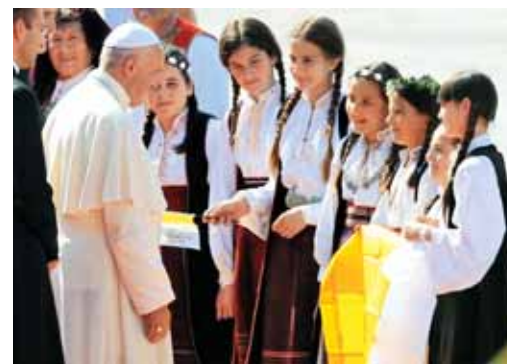
Mladi so upanje mirnega sožitja tudi v BiH.

Že iz prvega stavka apostolskega pisma lahko razvijemo nekatere njegove misli o ljubezni, da bi se znali veseliti daru ljubezni. Spominjajo nas, da ljubezni ne smemo ljubosumno opazovati, še manj pa pokroviteljsko komentirati. Vsekakor pa ni spodobno ljubezni vnašati v čenče in trač ob kavici. Dobro deluje le naše veselje ob srečanjih z njo. Lahko bi razvili novo občutljivost za dejstvo, da je ljubezen več kot le zasebnost. Potrebno jo je dojemati ne-