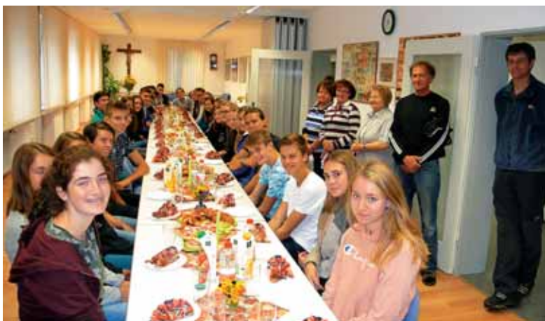
Pogostitev dijakov iz Slovenije

južni del, v bližino Augsburga. Tu si je ustvaril svoj družinski raj, kjer še vedno živi in se rad spominja vsega, kar ga je v življenju osrečevalo. Pred dvema letoma mu je umrla žena. V srcu jo nosi neizbrisno zapisano. Ob svoji 80. okrogli obletnici