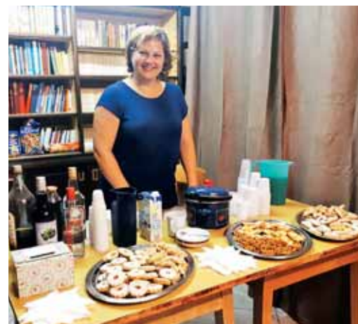
Okrepčilo za romarje v Ehrlichovem domu na Sv. Višarjah

Ja, to je naša zgodovina, to je naš narod, to je naša domovina! Lepo je bilo! Še pridemo, še se