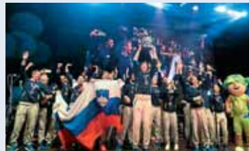
Sprejem zlatih košarkarjev na Kongresnem trgu

KOŠARKA. V Sloveniji še vedno odmeva zgodovinski rezultat moške košarkarske reprezentance, ki je postala evropski prvak. Slovenski kapetan Goran Dragić je na finalni tekmi proti reprezentanci Srbije dosegel 35 točk, izbran pa je bil tudi za najkoristnejšega igralca prvenstva. V najboljšo peterko prvenstva se je uvrstil še 18-letni slovenski košarkar Luka Dončić. Na Kongresnem trgu v Ljubljani so našim košarkarjem pripravili sprejem, kljub dežju jih je pozdravilo 20.000 navijačev. Za košarkarsko zlato jim je čestital tudi predsednik države Borut Pahor, ki se je odločil, da bo slovenski košarkarski reprezentanci podelil državno odlikovanje zlati red za zasluge za izjemen športni dosežek, uveljavljanje Slovenije na svetovnem športnem prizorišču, krepitev nacionalnega ponosa in za navdih ljudem.