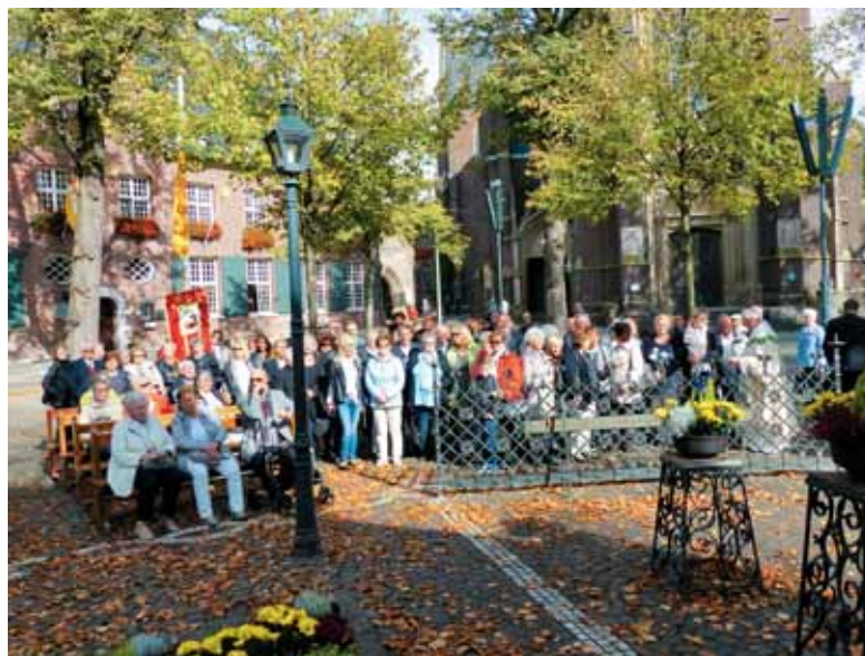
Pred milostno kapelo v Kevelaerju 2017