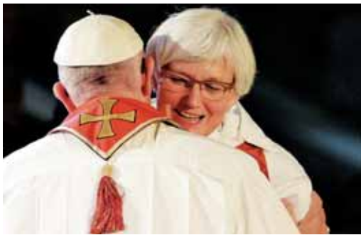
Ekumenski objem s škofinjo Švedske luteranske cerkve

knil od tako imenovanih 'praktičnih namenov', kot so zvestoba, nerazveznost in posredovanje življenja, ki naj bi uravnavali spolno poželenje v urejene tirnice. V središče pozornosti postavlja odnos med zakoncema. Za mnoge vernike je bil nov in osvežujoč opis zakonske zveze s svetopisemsko podobo zaveze, kar je v prvi vrsti predanost in ne le pogodba. Osrednja je izkušnja ljubezni med možem in ženo, ta je pomembna tudi v Cerkv in za Cerkev.