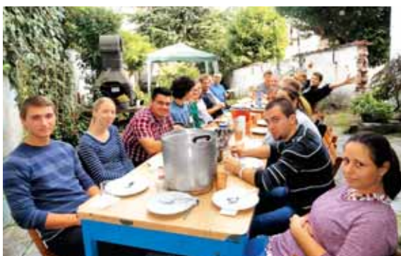
Dijaki jezuitskega kolegija Magis – tudi ob pašti in rižu se da lepo preživeti.