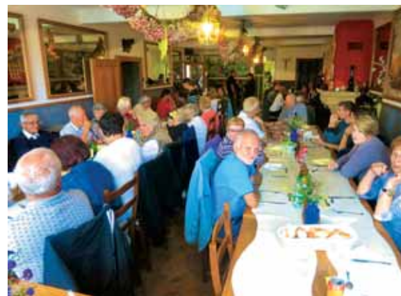
Kosilo na celodnevem srečanju 10. septembra v Merlebachu