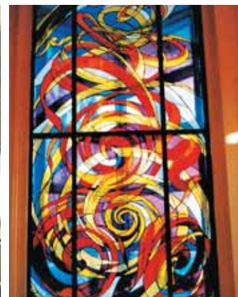
Vitraj v kapeli Marijinih sester v Mirju

stajanja. S tem so predstavljala proces, ne pa končnega izdelka. V osemdesetih letih se je slikarka vpela v t. i. »transcendenčno spiralo«. Na mnogih njenih platnih so se pričele pojavljati bolj ali manj zaprte krožne linije, v katerih bi bilo mogoče videti rojstvo, embrij ali celo galaksije. Vsekakor bi se ob tem motivu lahko posvetili razlagi o globoki simboliki.