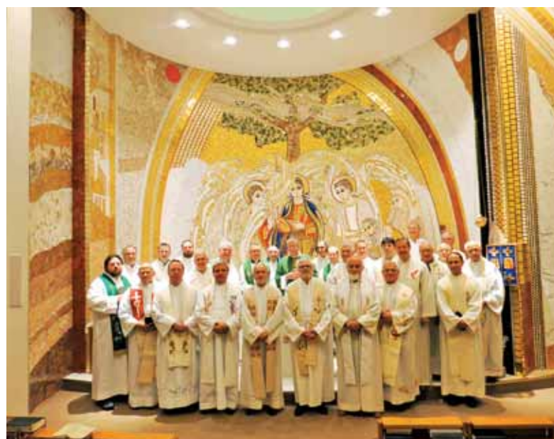
Ob zaključku duhovnih vaj v Tinjah

Po daljšem iskanju in posvetovanju smo našli sicer ne povsem ugodno rešitev za našo dopoldansko nedeljsko mašo v Frankfurtu. Ugodnost je, ker ni dosti daleč stran od sedanjega kraja pri klaretincih in je na voljo dovolj parkirnih prostorov. Tudi tramvaj št. 16 ima prav v bližini svoje postajališče. Manj ugodno pa je, ker moramo z mašo začeti pol ure prej ( ob 9.30 ) in končati v eni uri. Tako ne bo možnosti za kakšen »podaljšek« npr. z majniško pobožnostjo; zaenkrat pa tudi še ni videti kakšnega prostora za kratko srečanje in pogovor po maši, razen zunaj na dvorišču. Dopoldansko mašo smo začeli z drugo nedeljo v oktobru v semeniški kapeli bogoslovnega semenišča, St. Georgen, Offenbacherlandstr. 224, 60599 Frankfurt . Popoldanska maša na prvo nedeljo v mesecu pa ostaja še naprej pri Poljakih v cerkvi Herz Marien (Auf dem Mühlberg 14, 60599 Frankfurt), kjer imamo na voljo tudi dvorano za naša srečanja in nekatere prireditve. rem