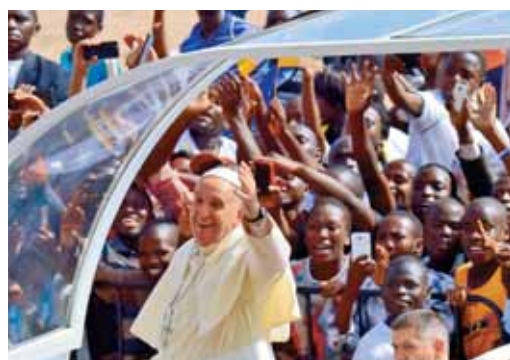
Navdušenje v Keniji in Ugandi