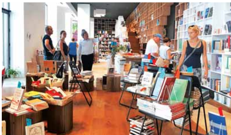
V slovenski knjigarni sredi Trsta

Tretji dan, sobota. Kako hitro čas beži. Kaj ne bi v dobri družbi in potepanjem med pričevalci slovenstva. Pridne roke so nam pripravile zajtrk. Teknil je, omamno pa je dišala tudi kava, ki nas je dodobra prebudila. Zapustili smo Marijanišče in se preko kraškega roba spustili z Opčin proti Trstu. Ob vznožju kraškega roba smo zavili proti gradu Miramar in se tako izognili središču Trsta. Grad Miramar nas je s svojo belo zunanostjo, tik nad morjem, že od daleč pozdravljala. Zato ni čudno, če se imenuje »Miramar«, kar v španščini pomeni »pogled na morje«. Danes je preurejen v muzej. V njegovi neposredni