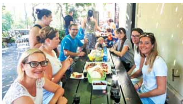
Krepčanje s kraškimi dobrotami v Mavhinjah