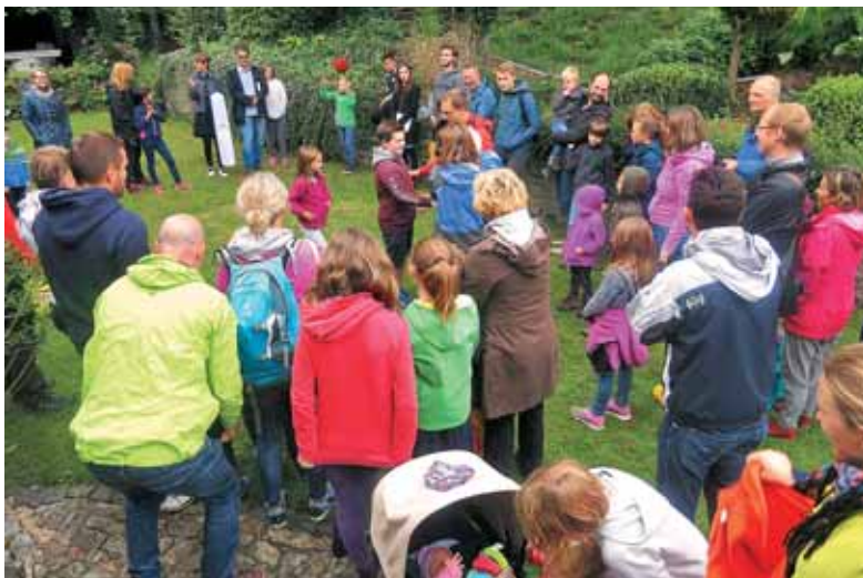
Pred starim mlinom je na začetku družinskega seminarja čas za predstavitev.