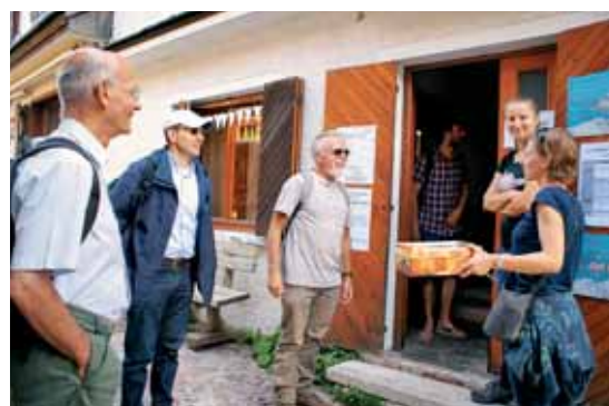
Sprejem prvih romarjev na Svetih Višarjah