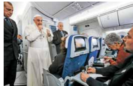
Novinarska konferenca v letalu

Ni vse tako idealno, kot so te podobe. Jasno je, da je na svetu toliko zločink in zločincev, ki prav to ma-