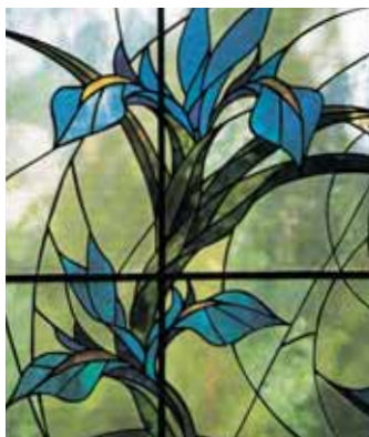
Detajl vitraja v kapeli sester notredamk v Ljubljani