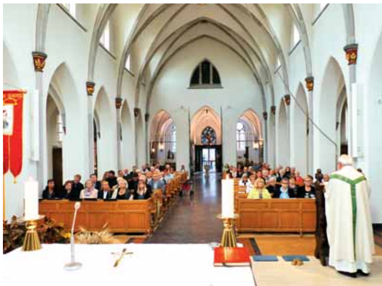
Med mašo v Kevelaerju 2017

Tistim, ki niste imeli posebnih ovir za udeležbo na romanju, smem reči, da vam je lahko zelo žal, ker niste bili z nami. Smo pa molili tudi za vas, zlasti pa za tiste, ki bi radi prišli, pa zaradi bolezni ali starosti niste mogli.