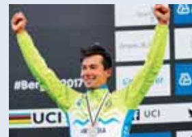
Primož Roglič, svetovni podprvak v kronometru

KOLESARSTVO. Na svetovnem prvenstvu v norveškem Bergnu je kolesar Primož Roglič osvojil srebro in naslov podprvaka v vožnji na čas. Roglič je tako postal prvi Slovenec z odličjem na svetovnem prvenstvu v kronometru.