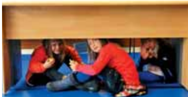
Po nedeljski maši je čas za okrepčilo in za igre.

V nedeljo, 17. septembra, smo se po poletnih počitnicah prvič zbrali v Chatillonu, v Parizu. Ob 11. uri smo imeli nedeljsko evharistično slavlje. Kapela je posvečena povišanju sv. križa. Pri liturgiji