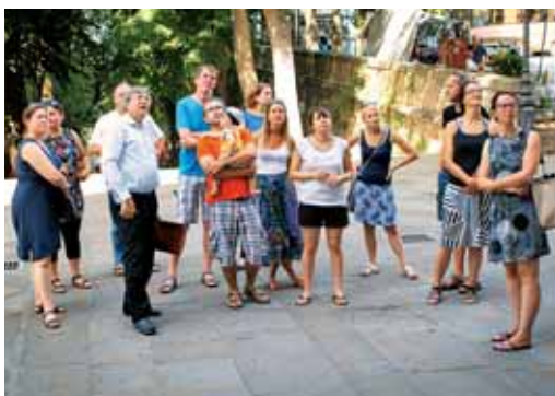
Udeleženci pred stolnico sv. Justa