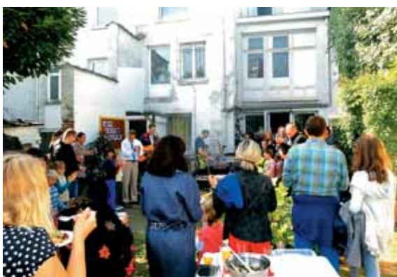
Vem, da danes bo srečen dan – pesem pred torto