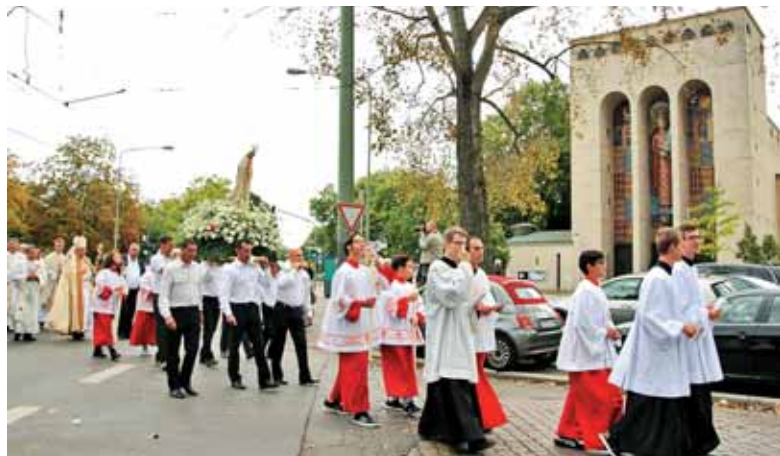
Del procesije pred cerkvijo Frauenfriedenskirche