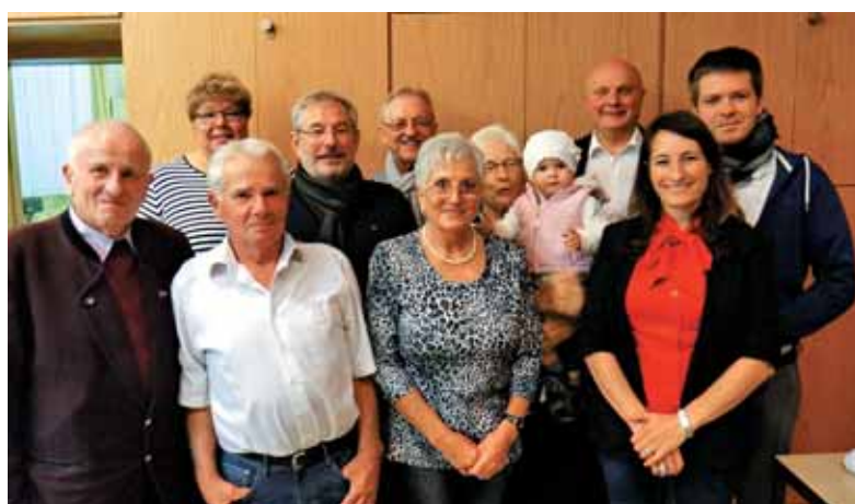
Zbrani po sv. maši v Aslu