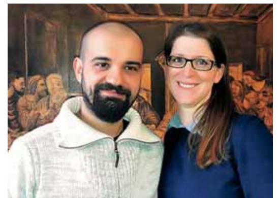
Mateja in Peter