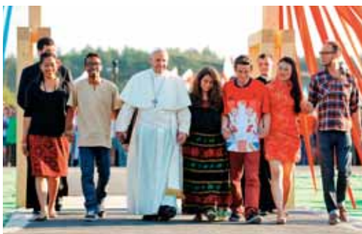
Na svetovnem dnevu mladih na Poljskem

Morda so družine najprej razumele, kaj želi povedati papež s tem 'evangelijem družine'. Včasih prej kot pastoralni delavci. Z njim Cerkev prisega na nezlomljivo ljubezen in zvestobo. Zaupanje v