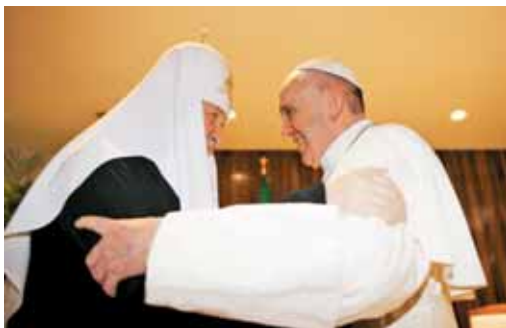
Zgodovinsko srečanje z moskovskim patriarhom Kirilom na Kubi

mar, kot da niso pomembne. To ne pomaga človeku na poti naprej. Ne eno ne drugo stališče namreč ne upošteva človeka kot takega. Spovednik tega ne sme dopustiti.« »Kaj naj potem storimo?« so me spraševali. »Bodite usmiljeni!« sem jih spodbujal.